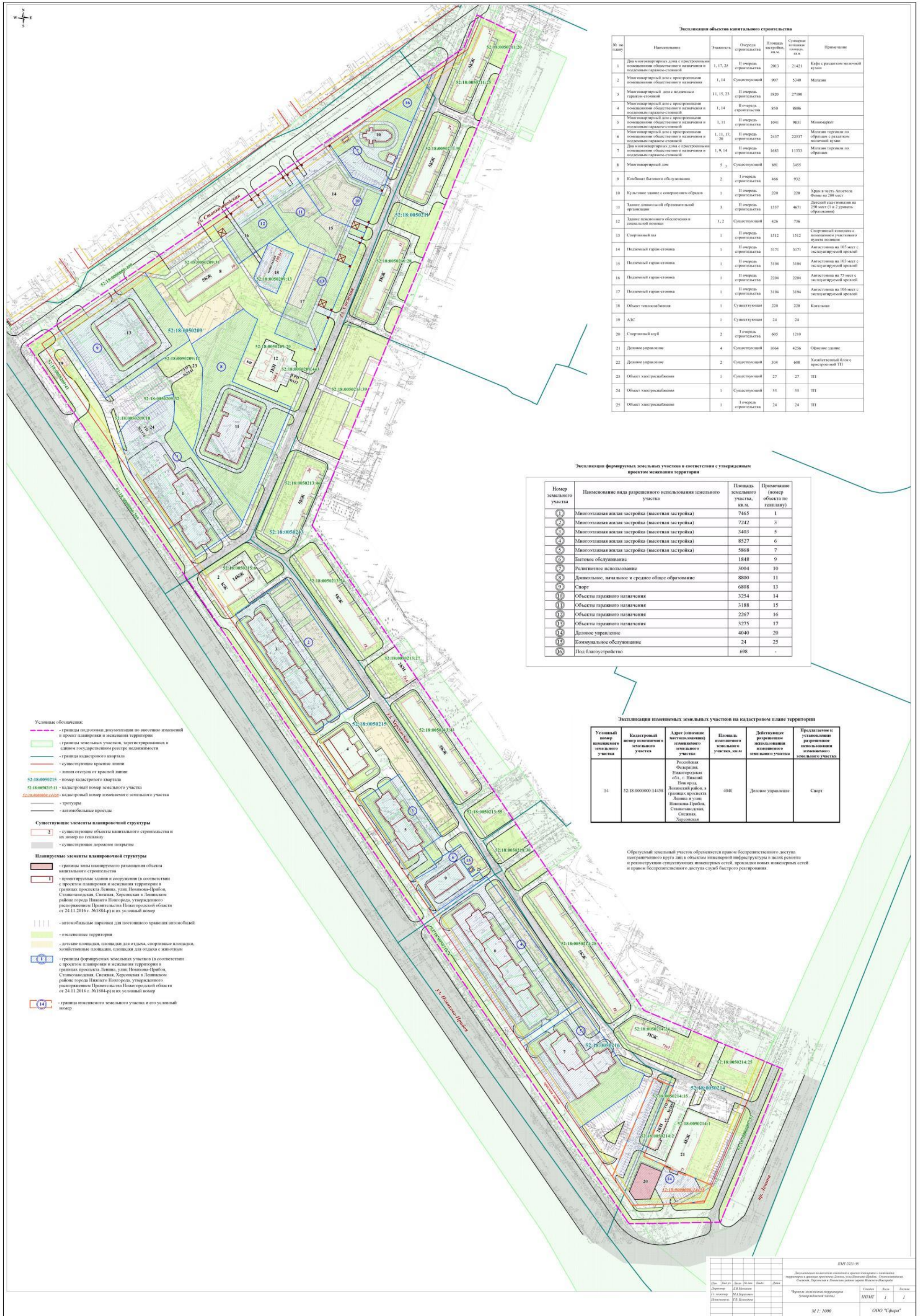
Экспликация объектов капитального строительства